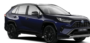
2RA Темно-синій, металік з чорним дахом 4