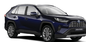
8X8 Темно-синій, металік 2