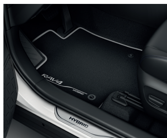
Килимки салону, текстильні