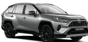
2QY Сріблястий, металік з чорним дахом 4