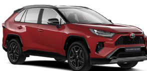
2SC Червоний, перламутр з чорним дахом 6