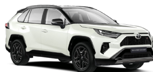
2PS Білий, перламутр з чорним дахом 4