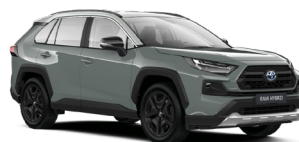
2QU Хакі, лак з сірим дахом 5