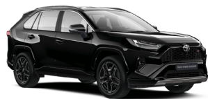
218 Чорний, металік 7