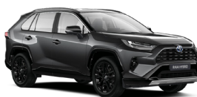
2QZ Сірий, металік з чорним дахом 4