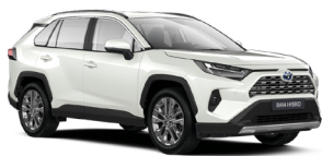
089 Білий, перламутр 2