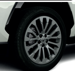
Колісні диски 19"