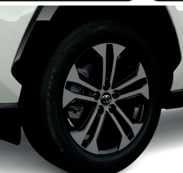
Колісні диски 18"