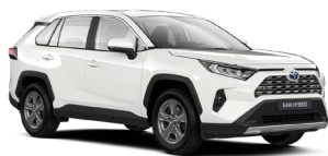
040 Білий, лак 1