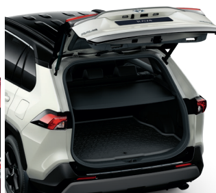
Килимок багажника, гумовий