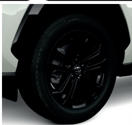
Колісні диски 17"