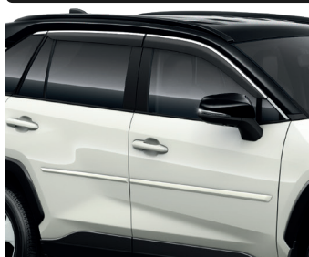
Молдинги дверей, Дефлектор вікон, Хромована накладка дверей багажного відділення