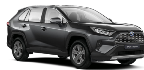
1G3 Сірий, металік 3