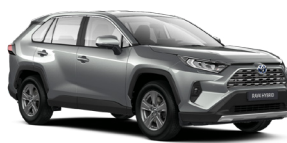
1D6 Сріблястий, металік 2