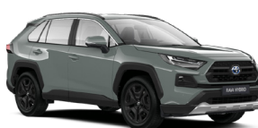
6X3 Хакі, лак 3