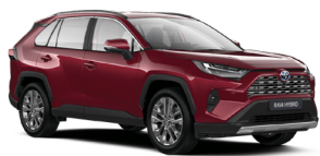
3T3 Червоний, перламутр 3