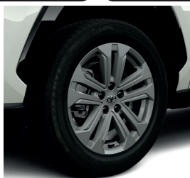
Колісні диски 18"