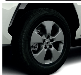
Колісні диски 17"