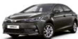
1G2 Сірий 2