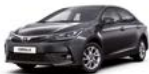
1G3 Сірий 2