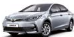
1F7 Сріблястий 2