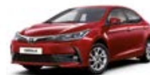
3T3 Червоний перламутр 2