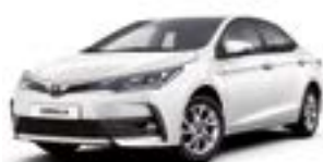
070 Білий перламутр 2