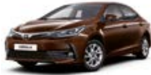
4U3 Коричневий 2