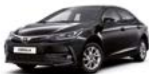
209 Чорний 2